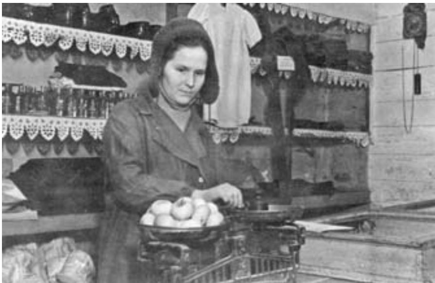
В магазине для военнослужащих в годы Великой Отечественной войны.