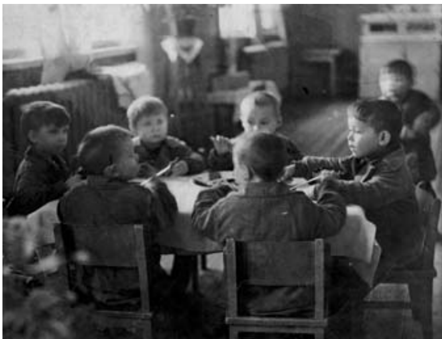
Дети фронтовиков за обедом в детском саду Ленинского района Нижнего Тагила. 1942 г.

Продовольственный вопрос особенно обострился в конце 1941 – начале 1942 гг. Централизованное снабжение было недостаточным, а собственная продовольственная база Нижнего Тагила не была рассчитана на резко возросшее население города. Калорийность питания за вторую половину 1941 г. сократилась для основной части тагильских рабочих с 3370 калорий до 1100–1600. Обычным явлением стали авитаминоз и дистрофия. В декабре 1941 г. на большинстве предприятий