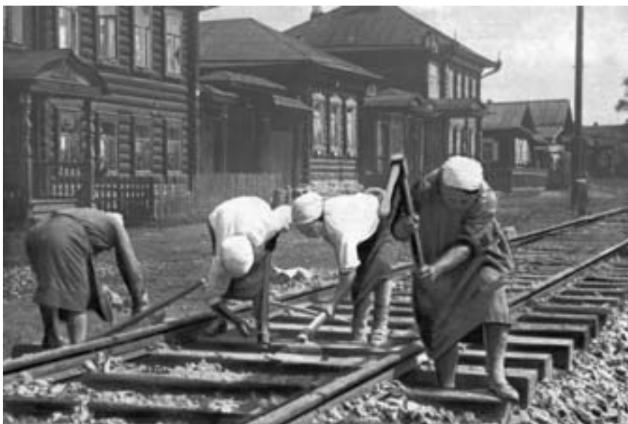
Строительство трамвайных путей в Нижнем Тагиле. 1936 г.

Реализации грандиозных проектов 30-х гг. помешала не только война. Работа архитекторов велась разрозненно, координация деятельности различных архитектурных коллективов длительное время отсутствовала.