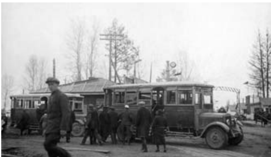
Автобусы в Нижнем Тагиле. 1930-е гг.

Рыночные цены на продовольственную продукцию были более высокими, чем на продукты в сети нормированного снабжения. В голодном 1933 г. при среднемесячной заработной плате тагильских рабочих в 100–200 руб. рыночные цены в городе колебались в следующих пределах (за 1 кг):