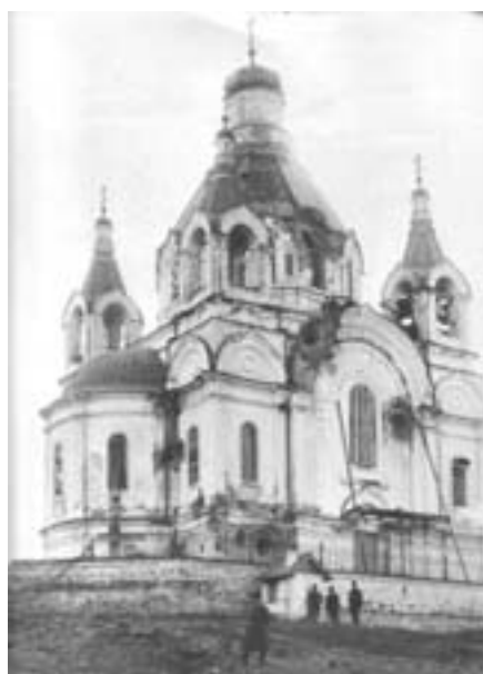
Церковь Александра Невского в 1918 г., повреждённая в ходе боёв.

Сразу же после освобождения города от власти большевиков началась большая чистка учительских кадров