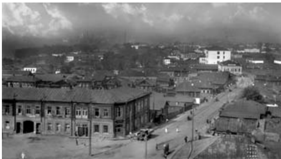
Центральная часть Нижнего Тагила. 1920-е гг.

Период 1917 – конца 30-х гг. – это время резких колебаний численности населения Нижнего Тагила. Первая общероссийская перепись 1897 г. зафиксировала наличие в Нижнем Тагиле 31 449 человек. Согласно данным земской статистики, население заводского посёлка в 1907 г. составляло 33 939 человек, а в 1909 выросло до 34 709 человек. К началу Первой мировой