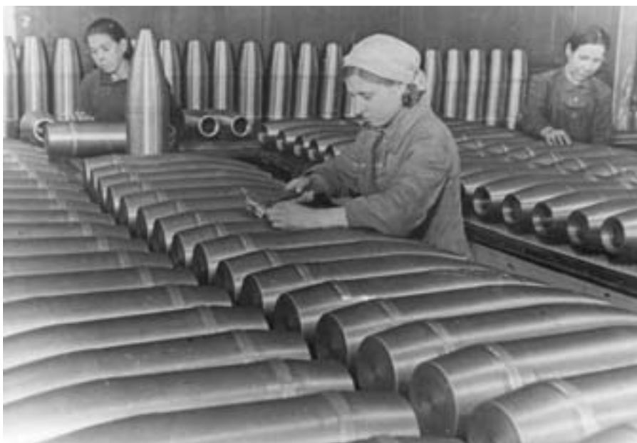
Работницы отдела технического контроля завода № 63 за приёмкой снарядов. 1943 г.

Стоимость бюджетного продуктового набора в государственных розничных ценах 1940 г. равнялась всего 44 руб. 33 коп. Именно эти цены использовались при отоваривании карточек. За годы войны цена продуктов, выдаваемых по карточкам, выросла незначительно. Таким образом, разли-