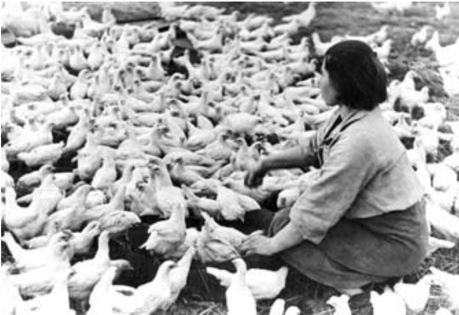
Кормление цыплят на птицеферме совхоза № 1 завода им. Куйбышева. 1943 г.

В 1944 г. было ненастное лето, дождями прибило пшеницу к земле, она полегла. Чтобы убрать урожай, срочно нужны были серпы. Лайский колхоз обратился к шефам, и на заводе № 63 в Нижнем Тагиле их сделали за один день. Высокогорцы сразу же привезли их в Лаю. В обмен на серпы работники Высокогорского механического завода получили часть урожая. Аналогичные шефские связи были широко развиты и с колхозами и совхозами Петрокамменского района, который являлся одним из важнейших поставщиков продовольствия в Нижний Тагил.