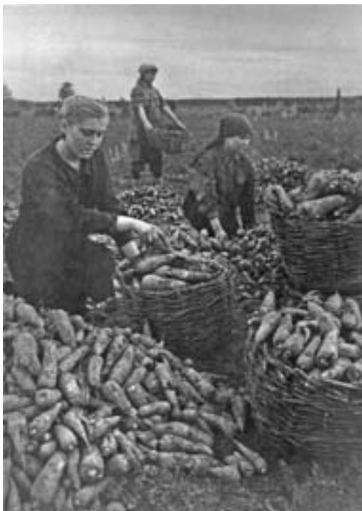
Сбор урожая моркови в подсобном хозяйстве завода им. Куйбышева. 1943 г.

Постепенно поступление продуктов питания по карточкам улучшалось, кроме хлеба по ним стали получать крупу, жиры, мясoproдукты, яичный порошок. «Иногда по талонам вместо сахара давали конфеты или печенье, а вместо мяса – яичный порошок. Особенно мне запомнилась консервированная колбаса в банках из Америки, которую довелось попробовать всего несколько раз», – вот одно из типичных воспоминаний военных лет 21 . Со временем всё большая часть горожан стала обеспечиваться по повышенным нормам. В середине 1942 г. только 40 % тагильчан снабжались хлебом по нормам для рабочих и служащих, а 60 % – по нормам для иждивенцев и детей. К концу 1944 г. уже половина горожан