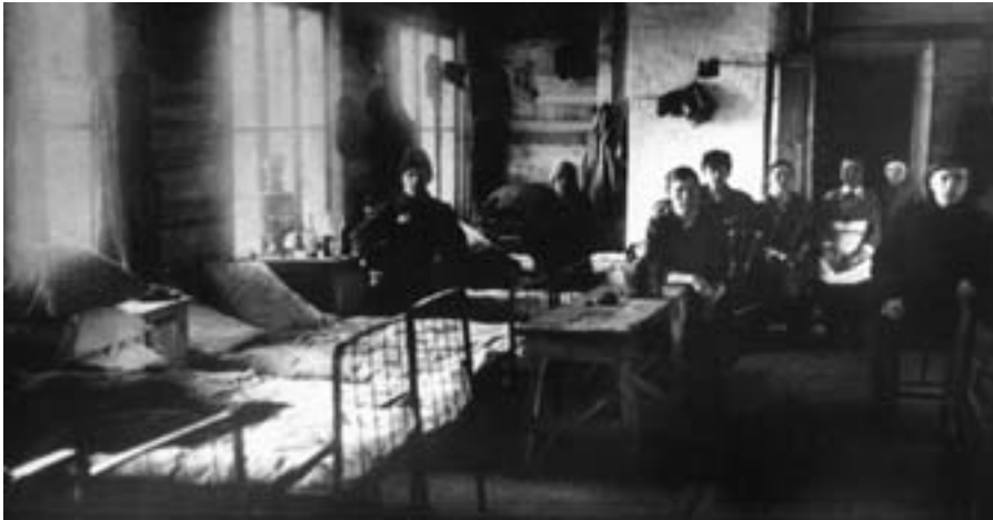
Внутренний вид барака первых «тагилстроевцев». Март 1931 г.

бывшие военнослужащие и работники тех учреждений, где она была обязательной, но и значительно более широкие слои населения. Особой популярностью пользовались френчи и галлифе. Иногда их специально шили из подходящего материала. Кожаная одежда – куртки и брюки – стала отличительным признаком руководящих партийных и советских работников 31 .