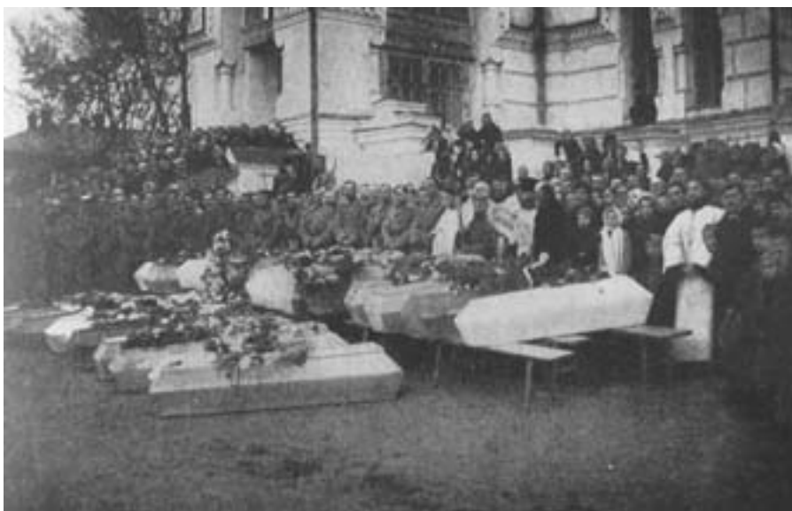
Отпевание погибших 8-го Силезского полка в Введенской церкви г. Нижнего Тагила. 8 октября 1918 г.

Для решения этой проблемы использовались добровольные пожертвования, закупки и реквизиции. В октябре 1918 г. в Нижнем Тагиле был организован Комитет по сбору тёплых вещей в белую армию. Среди прочего собирались валенки, тёплые носки, портянки, шапки, варежки, тёплое бельё, полушубки. В ноябре 1918 г. уполномоченный министерства снабжения по Верхотурскому уезду призывал тагильчан: «Зимние морозы застали армию без тёплой одежды. Граждане, ис-