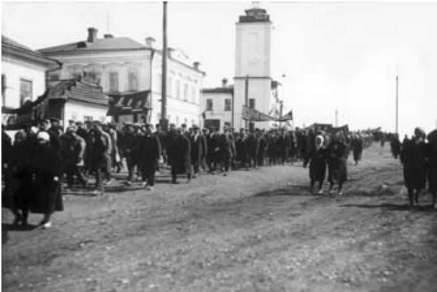
Праздничная демонстрация на ул. Ленина. 1930-е гг.

войны численность населения города практически не изменилась 6 .