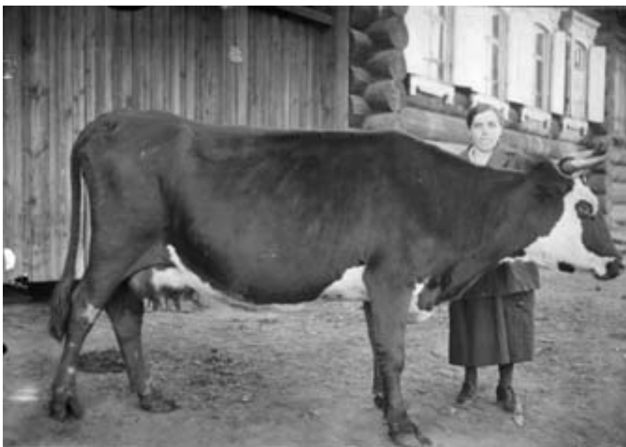
Жительница Нижнего Тагила с коровой тагильской породы – призёром сельскохозяйственной выставки. 1920–30-е гг.

Особенно тяжёлым в 30-е гг. было положение с промышленными товарами. Одежда, обувь, мебель и домашняя утварь стали настолько дефицитными, что ими часто награждали пе-