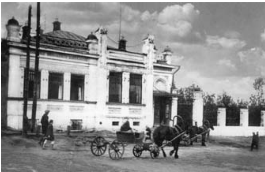
Дом А.И.Треухова по улице Шамина (ныне К.Маркса, 21), где в августе-сентябре 1918 г. располагалась большевистская ЧК, позже – военно-следственная комиссия Белой армии.