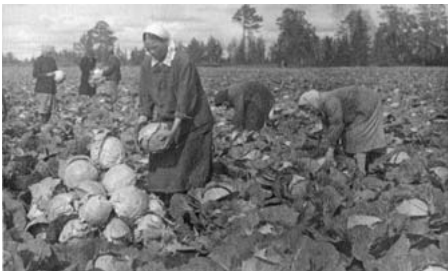
Сбор урожая капусты в подсобном хозяйстве завода № 183. 1943 г.