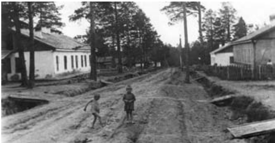
Посёлок Нижнетагильского коксохимзавода. 1930-е гг.