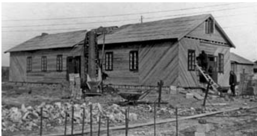
Первые деревянные бараки строителей тагильских индустриальных гигантов. Начало 1930-х гг.

Новшеством в 20-е гг. стало значительное распространение одежды военного покроя. Её носили не только