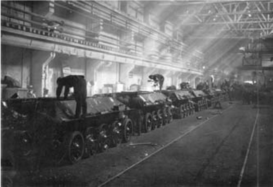
Сборка танков на главном конвейере завода № 183.

более желанной добычей. Чтобы убе- речься от воров, многие тагильчане карточки на хлеб разрезали на дека- ды, скрепляли или сшивали в левом углу и так ходили за хлебом. Если ук- радут, то хоть не всю карточку 68 .