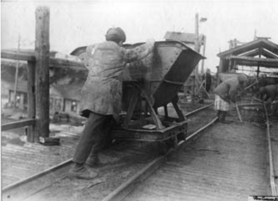
На эстакаде подъёмников Высокогорского железного рудника. 1934 г.

редовиков производства в качестве высшей награды. Большинство тагильчан в 30-е гг. одевалось очень скромно. Так, например, известный тагильский журналист Ю.П.Злыгостев, составитель и литографчик книги «Были горы Высокой», в 1930 г. предстал перед рабкором Григорием Быковым в таком виде: «Я взглянул на его ботинки и засмеялся: большие были, стоптанные и носки кверху загнуты, ровно елевый сук в погоду хорошую. Ну, и брючишки на нём не пряткие». Как показало одно из ретроспективных исследований уральских социологов, факт приобретения первого выходного костюма в жизни людей 30-х гг. был одним из самых важных событий в жизни. Ветераны (спустя 40 лет) без особых усилий вспоминали год и месяц его появления, цвет, материал и даже те чувства, которые они при этом испытывали 50 .