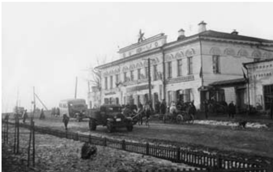
Ул. Ленина. Конец 1930-х гг.