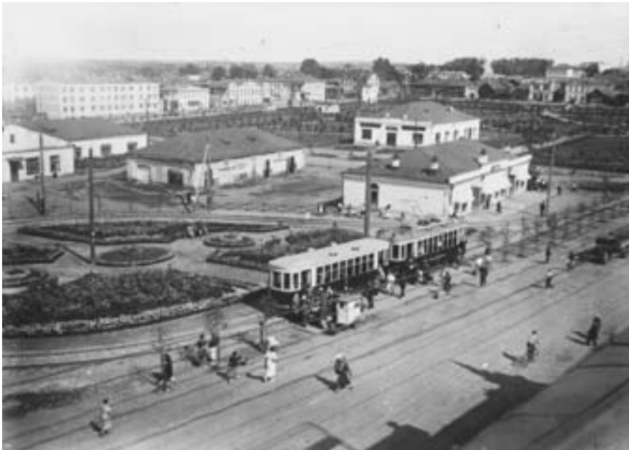
Трамвайное кольцо на ул. Ленина. Конец 1930-х гг.

ных трамваем пассажиров возросло до 15 млн, а число поездок на одного жителя – до 83. Новый вид городского транспорта постепенно становился важнейшим средством передвижения, вытесняя традиционных извозчиков. В 1933 г. на средства промышленных предприятий Нижнего Тагила было организовано автобусное сообщение по маршруту: Уралвагонстрой – Металлургический завод имени Куйбышева – Рудник имени III Интернационала. В 1938 г. автобусный парк города состоял из 29 машин. Однако, в отличие от трамвайного, автобусное сообщение было крайне нерегулярным, кроме того, автобусы обслуживали лишь работников «своих» предприятий. В крайнем случае можно было воспользоваться услугами попутной грузовой машины (легковых было очень мало и