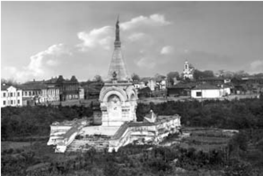
Памятник Свободе. 1920-е гг.

1, рыба (сельдь) – 1,8; сахар-рафинад – 2, соль – 2, молоко – 12 бутылок и яйца – 6 штук. Кроме того, в него входили 2 аршина ситца, 6 фунтов керосина, 3 коробки спичек и некоторые другие промышленные товары. Стоимость такого набора в Нижнем Тагиле в 1913–1914 гг. (среднемесячная) составила 6 руб. 35 коп., в сентябре 1916 г. – 18 руб. 50 коп., в феврале 1917 г. – 29 руб. 30 коп., в мае 1918 г. – 115 руб. и в августе 1919 г. – свыше 340 руб. В июне 1921 г. стоимость бюджетного потребительского набора достигла астрономической суммы в 543 тыс. руб., а в декабре 1922 г. – 138 млн руб. 22 Данные за 1918–1922 гг. относятся к Тагилу под властью красных.